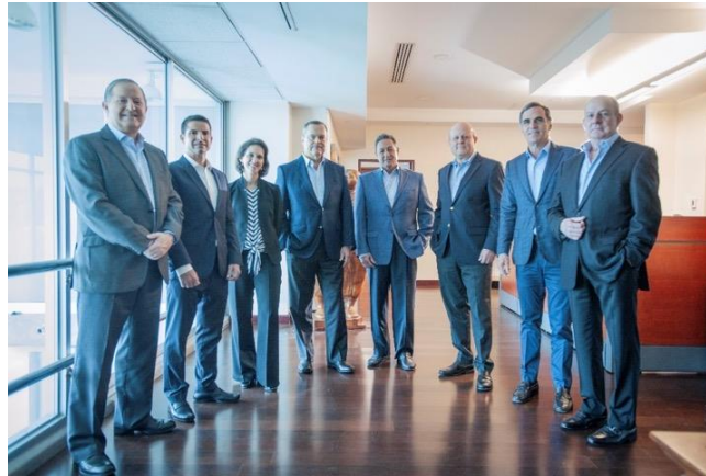
Ilustración 2 - Junta Directiva vigente

Los directores fueron electos en Asamblea General Ordinaria de Accionistas celebrada el 13 de diciembre de 2018, por el periodo del 1 de enero del 2019 al 31 de diciembre de 2020 6 . La Junta Directiva se encuentra integrada de la siguiente forma: