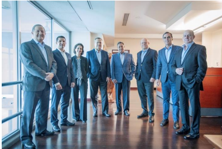
Ilustración 1 - Junta Directiva vigente

Los directores fueron electos en Asamblea General Ordinaria de Accionistas celebrada el 13 de diciembre de 2018, por el periodo del 1 de enero del 2019 al 31 de diciembre de 2020. La Junta Directiva se encuentra integrada de la siguiente forma: